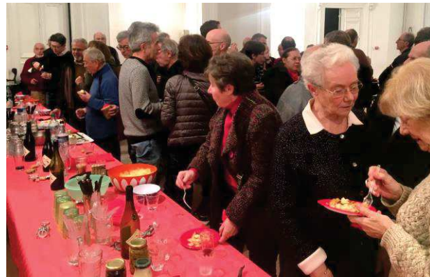
Échanges et rencontres autour du buffet