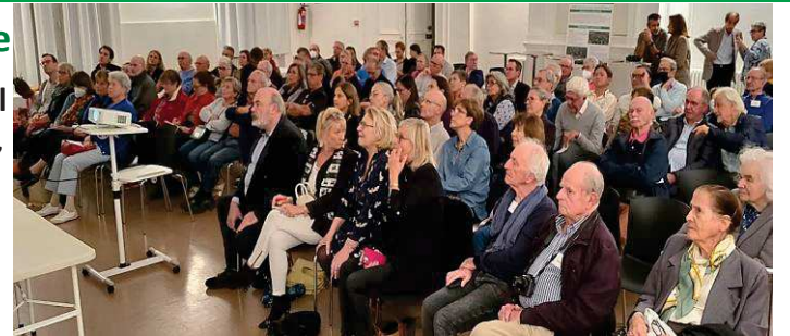
Chaque année, une assistance nombreuse vient s'informer sur l'actualité et les nouveautés du lotissement

Vendredi 18 octobre à 18h à l'ancienne mairie de Sceaux : une occasion unique de rencontrer de nouveaux voisins, d' échanger avec les autres riverains et de discuter de l'actualité du lotissement.