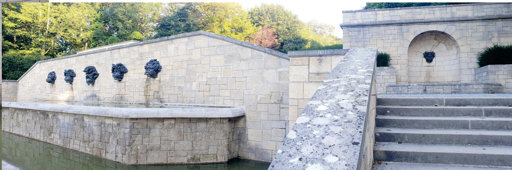
Les cinq mascarons du buffet d'eau ; à droite celui de la grotte qui fait pendant à celle de gauche.